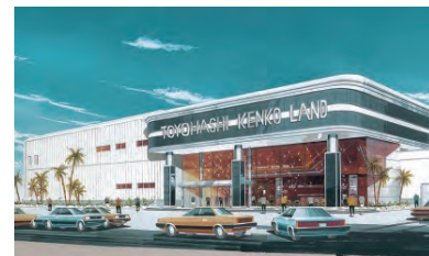
▲豊橋健康ランド外観