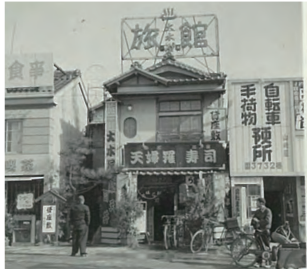
▲創業当時の料理飲食旅館「大木屋」。豊橋の町の発展とともに賑わいを見せた。▲