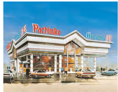
▲グランプリオーギ

昭和47年 豊橋市小向町に駐車場付遊技場 (グランプリオーギ350台収容)新設 郊外型パチンコ店舗1号店。