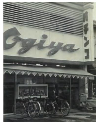
▲当時のパチンコ店