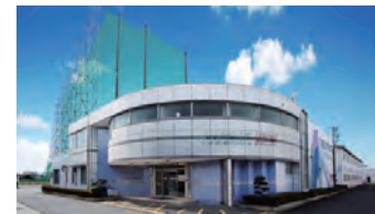
▲ハーバー・ビュー外観と打席