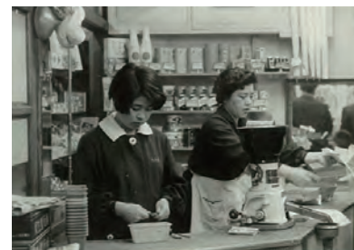
▲当時のパチンコ店