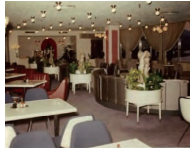
▲レークサイドチャオ店内(当時)

昭和42年 豊橋市松葉町においてバー・バンビーナ、 商工会議所内に喫茶ローマを、向山ボウリング階 上に軽飲食店レークサイドチャオを開店 バンビーナは「バーは暗いもの」というイメージを一新。 明るい店内、明朗会計での営業は好評を博した。