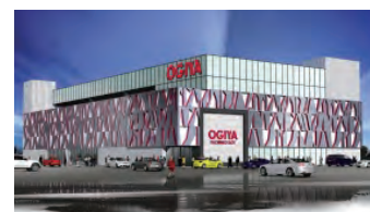
▲オーギヤ豊川蔵子店